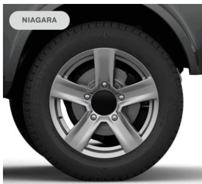
16" zliatinové disky kolies, pneumatiky 185/75 R16 Pre výbavu Luxe A/C