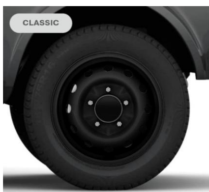
16" oceľové disky kolies, pneumatiky 185/75 R16 Pre výbavu Classic