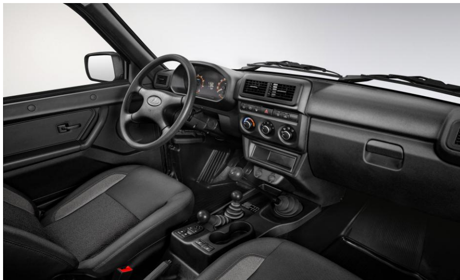
Látkové čalúnenie Pre výbavu Classic a Luxe A/C